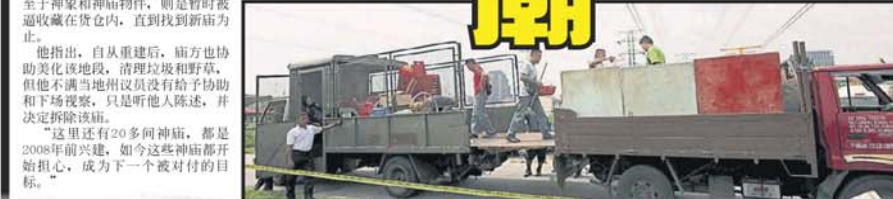
■理事们把神象和神庙物品，搬上罗厘载走。

他指出，该庙原本只是一间小木屋，用来存放普度宴会后神像及神轿，该庙在2015年注册后，募款大兴土木重建新庙，同时也建了停车场，因能对此非常反对，因为太靠近电视，非常危险。 “附近居民也反对，投诉烟灰污染空气，惟居民不敢向神廟投诉。”