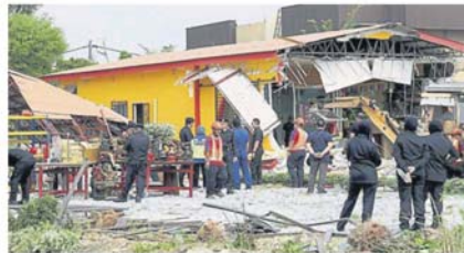
执法人员如火如荼展开拆庙工作。

由于拆庙阵容庞大且封锁多条路段，为此，也引起市民好奇将现场过程拍摄下来，上载面子书巴生社区专页发问，进而引来更多网民的高度