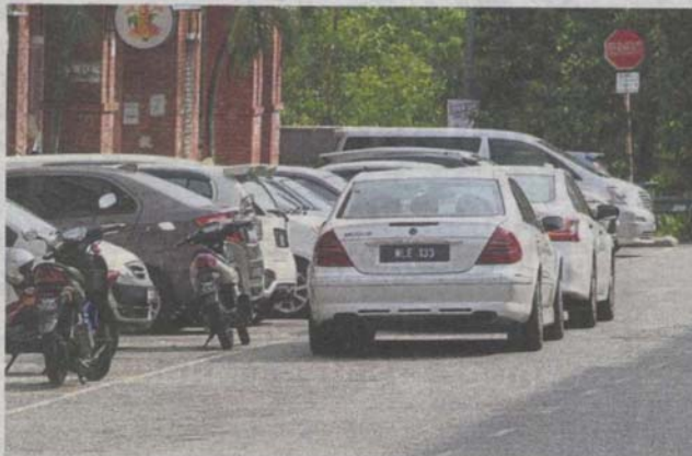
In Bandar Sungai Long, double-parking cases can be as many as 25 a day.

Law said clamping and towing and the fines were stipulated under the Street Drainage and Building Act.