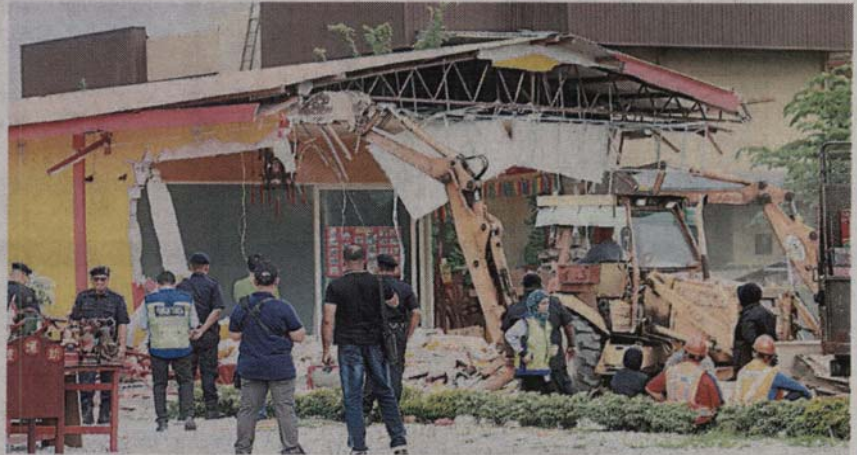
■执法人员将非法扩建的神庙拆除，庙方感到遗憾。

(巴生21日讯) 巴生永安镇国能高压电缆下，一家被指非法扩建的华人神庙，遭巴生市议会执法人员拆除。