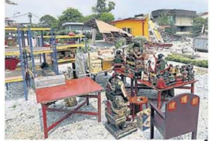
■理事们把神象搬到空地，避免遭砖瓦压毁。

据知，該廟有逾40年历史，根据州府政策，建于2008年前的旧庙都不会被对付，惟不可再度扩建，如果要进行翻新工作，必须向相关单位提出申请。 这间神廟被指在2年前，悄悄在国能地段原址上重建，并没有获得相关单位的批准和同意。