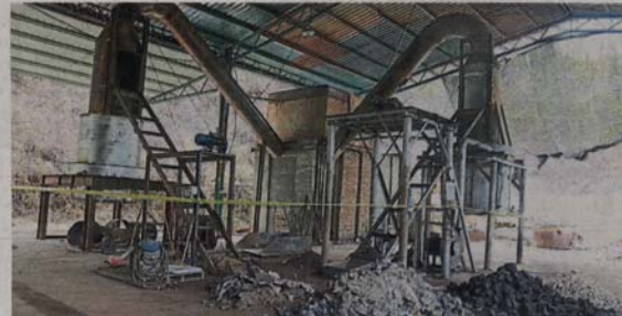
■ 合金炼厂因没有营业准证，并设于不适宜的地点，而遭森州环境局执法组取缔。