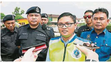
賽夫(前右二)說，雪州大臣並沒有下令暫緩拆廟，土地局只是依法行事。