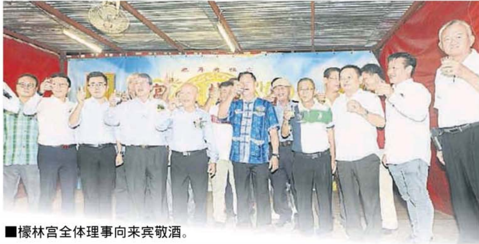
■ 檳林宮全體理事向來賓敬酒。