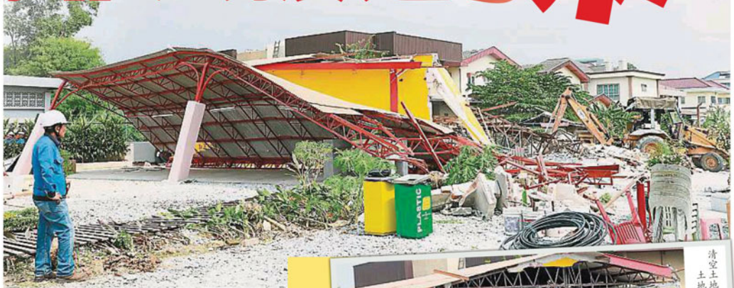
經過一段時間，神廟被神手推垮了。

為免影響拆廟行動，警方大陣仗以黃色警戒線關閉通往神廟路段，就連記者和攝影要採訪也被嚴陣地檢查身分，大批人群則集圍觀。