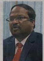
■ 威拉班：违例者将受到严厉对付，他呼吁任何工厂必须遵守条例。