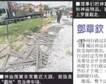
■神廟圍牆非常靠近大路，被指是“霸地”充当停車場。