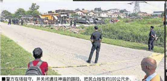
■警方在场驻守，并关闭通往神廟的路段，把民众挡在约100公尺外。