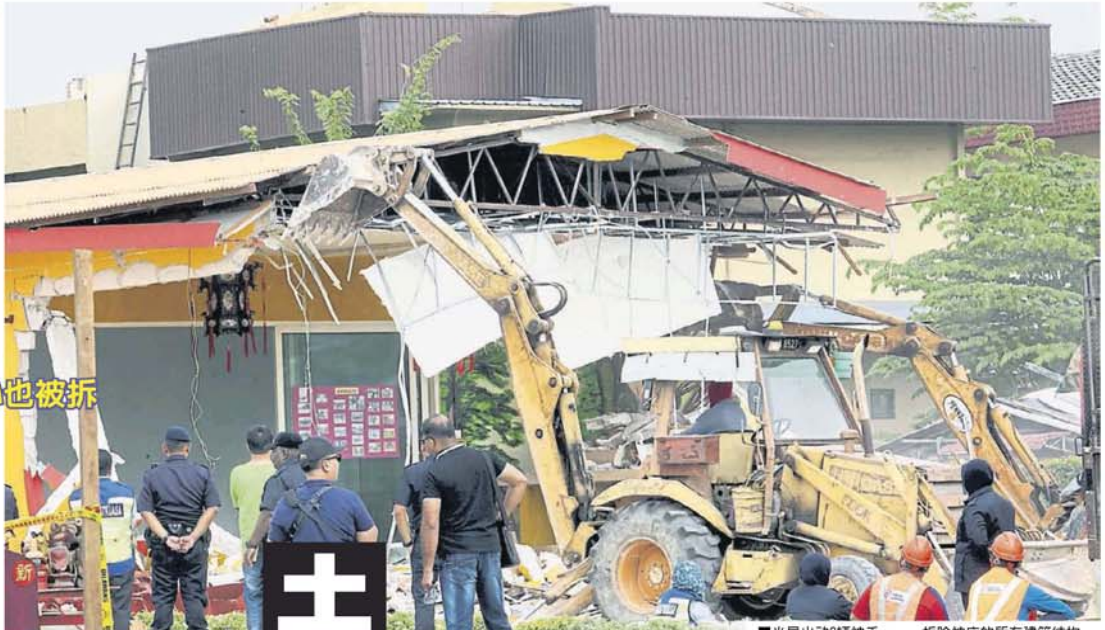
■当局出动2辆神手，一一拆除神庙的所有建筑结构。

除1间庙，其余20多间神庙心惶惶！ 据了解，拆庙现场附近有20多间神庙，其中有在电缆下就有四、五间，随着新莲坛被拆除后，其余神庙理事也开始提心吊胆，担心成为下一个被拆除的目标。 现场有理事成员指出，执法人员透露风声，新莲坛只是第一间，接下来其余在电缆下的神庙，也会陆续被拆除。